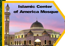
Islamic Center of America Mosque