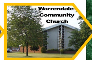
Warrendale Community Church