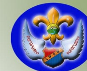
Homenetmen Armenian General Athletic Union and Scouts