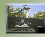
Armenian Community Center