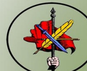
Armenian Revolutionary Federation